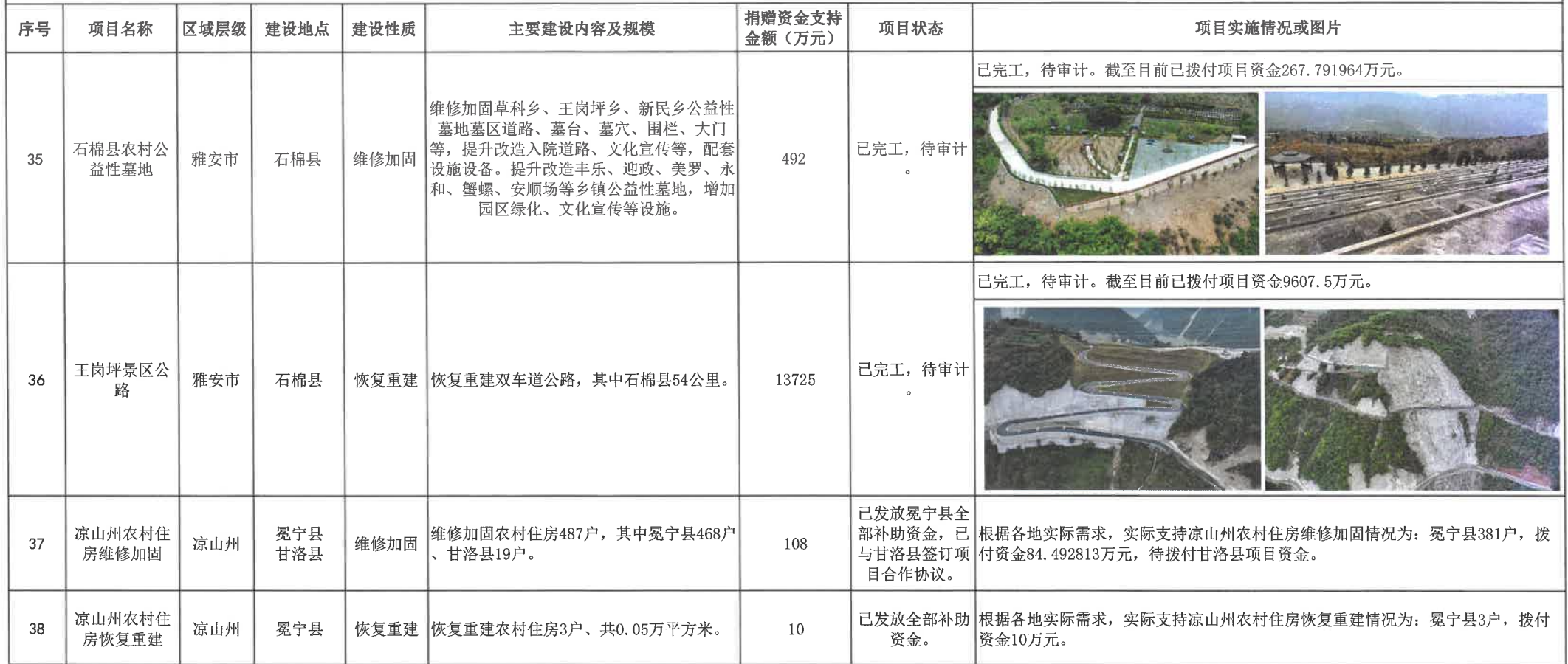
“9·5” 泸定地震捐赠资金支持项目进展一览表