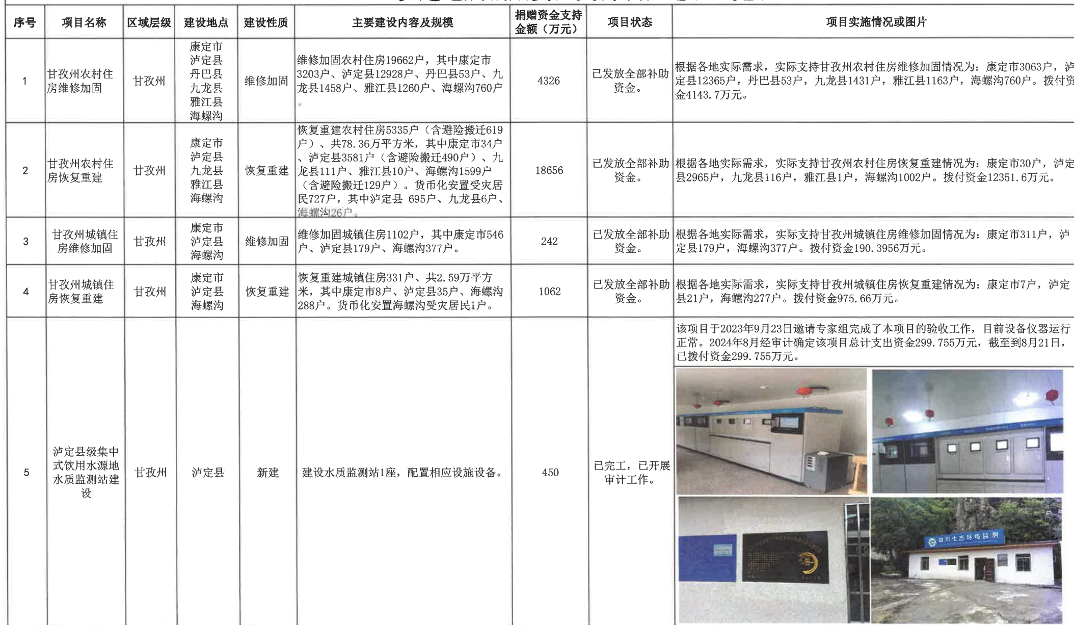
“9·5”泸定地震捐赠资金支持项目进展一览表